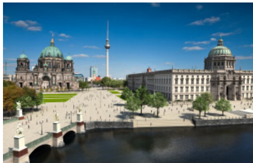
< Neues Stadt- schloss >Gendarmen- markt

Der Neubau des anfangs umstrittenen Stadtschlusses aus dem 18. Jh. Schon vor der offiziellen Eröffnung im Herbst 2019 wurde der „Schlüterhof“ zum Besuchermagneten. Der Reichstag/ Bundestag mit der Kuppel von Norman Foster im Regierungsviertel Der „Tränenpalast“ – zur DDR- Zeit Ausreisehalle in den Westen, heute Museum Der Gendarmenmarkt, einer der schönsten Plätze Europas mit Deutschem und Französischem Dom ( Hugenotten!) Am Gendarmenmarkt liegt zentral unser Hotel.